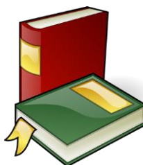
Boite à outils